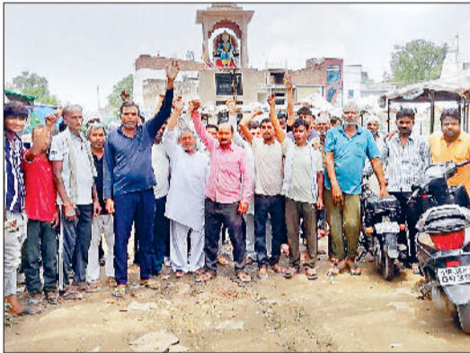
नारनौल। चितवन वाटिका में अग्रसेन प्रतिमा के सामने नारेबाजी करते रेहड़ीवाले व चेतावनी के बाद चितवन वाटिका में बिना सब्जी के खाली खड़ी रेहड़ियां।