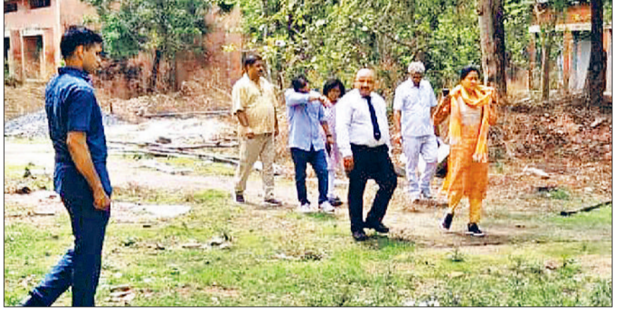
महेन्द्रगढ़। महेन्द्रगढ़ किले का निरीक्षण करती विभाग की टीम।