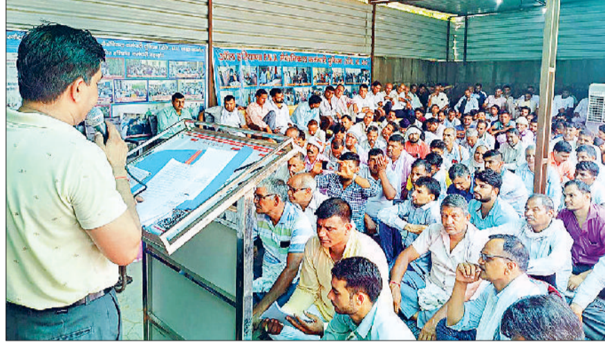
नारनौल। बैठक को संबोधित यूनियन के पदाधिकारी।

यादव के कार्यालय व आवास का घेराव तथा प्रदर्शन किया जाएगा। इसके बाद 22 अगस्त को मुख्यमंत्री नाथ सिंह सैनी के कैम्प कार्यालय नारायणगढ़ पर प्रदर्शन व घेराव करने व कर्मचारियों का मांग पत्र सौंपने का निर्णय लिया। इस जिला कार्यकर्ता सम्मेलन में संगठन से संबंधित जिले के सभी कर्मचारी व पदाधिकारी उपस्थित रहे।