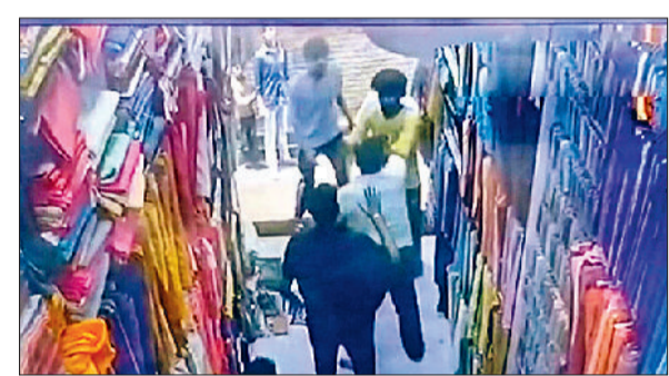
नारनौल। सीसीटीवी में कैद दुकानदार की पीटाई करते आरोपित।