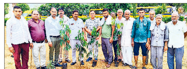
महेन्द्रगढ़। विद्यालय में पौधारोपण करते हुए।