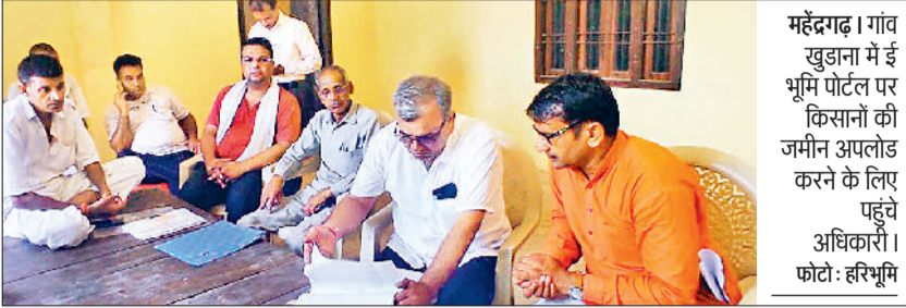
महेन्द्रगढ़। गांव खुडाना में ई भूमि पोर्टल पर किसानों की जमीन अपलोड करने के लिए पहुंचे अधिकारी।

गांव खुडाना में प्रस्तावित आईएमटी के लिए जमीन अधिग्रहण की प्रक्रिया शुरू कराने के लिए सोमवार को राजस्व व एचएसआईआईसी की टीम गांव में पहुंची, लेकिन नेटवर्क की समस्या होने के चलते केवल 8 कैनाल जमीन ही पोर्टल पर अपलोड हो पाई। मंगलवार को ग्राम पंचायत की ओर से टीम को